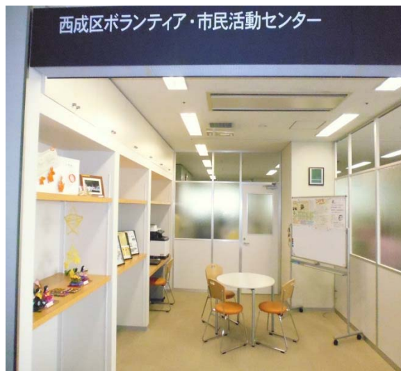
(情報・交流スペース)

いろんな想いをお聞かせください。 私たちコーディネーターやボラセンに集う みんなとカタチにしませんか。