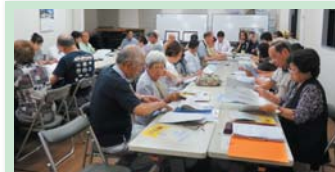
西成つながり名簿受渡しに向けての説明会

また、「西成つながり名簿」を通じて、地域の方々とのつながりのある方の確認をしていただきましたが、つながりのない方々と今後どのようにつながり、日頃の見守り活動や災害時の支援について検討する機会が必要であると共有できました。