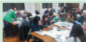
ワークショップにて見守り活動を考える