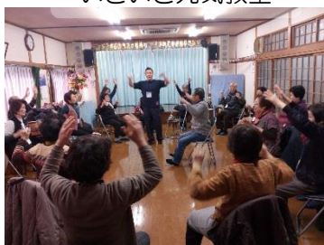
いきいき元気教室