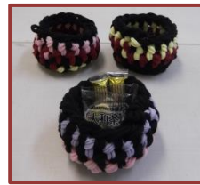
直径12センチの小物入れ お菓子入れにぴったり!?

●日時：6月14日(金) 午後1時30分～3時 ●定員：30名 (定員になり次第締切り) ●費用：100円 (材料費として) ●申込み：5月27日(月)～事務室にて受付