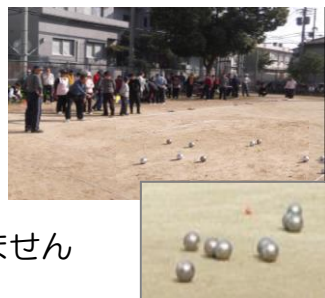
鉄の玉を投げます