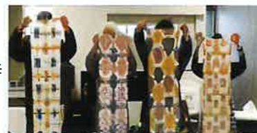
写真は令和3年度に開催した「べんがら染め」の様子です。

日 程：奇数月の第2水曜日 偶数月の第3木曜日 時 間：いずれも午後1時30分～3時 開催場所：西成区社会福祉協議会など 費 用：100円（お茶代）