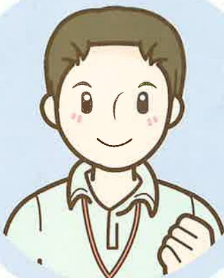
主任 ケアマネジャー