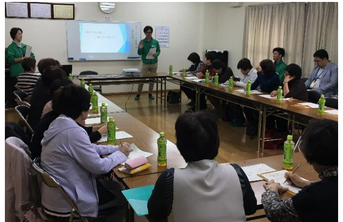
事例報告に熱心に耳を傾ける岸里地域ネットワーク委員

西成包括からは、体操やウォーキングなど介護予防教室の様子や、長年、人との関わりを持たずに過ごしてきた高齢者が、包括職員と関わる中で病院の受診や介護保険の申請につながった事例を報告。参加者からは「普段の見守り活動の中でも