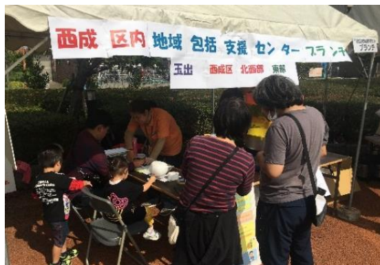
多くの家族づれの方に相談窓口を紹介できました

会場には高齢者だけでなく、これから介護に関わる世代も多く来場し、「近くの相談窓口を知ることができた」との声が聞かれました。